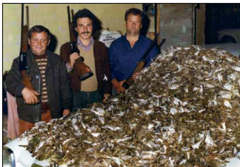
I tre amici davanti al bottino.

Certo che a quei tempi lo spiedo con polenta era il piatto che andava per la maggiore con il