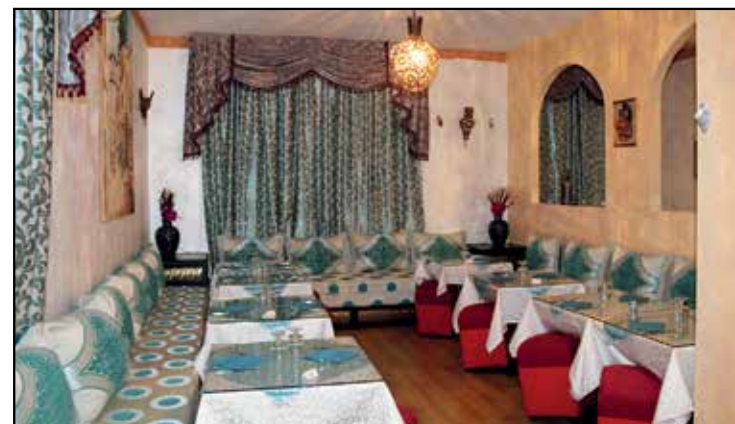
SALE INTERNE CON POSTI RISERVATI

MENU' ALLA CARTA PIATTI DELLA CUCINA SIRIANA VINO BIANCO-ROSSO-BIRRA-GRAPPA SIRIANI