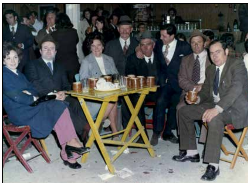
Aprile 1972, un brindisi alla Fiera.

Partiamo dall'INNOVAZIONE. Questa edizione appena conclusa segna una forte crescita di operatori che hanno esposto il meglio delle nuove tecnologie per un mondo, quello agricolo, in continua evoluzione. Ditte che hanno sempre trovato risposte nel tempo alle nuove esigenze del mondo agricolo e che ora sono protagoniste anche a livello europeo. In tal senso servirebbe creare sinergie per avere la presenza di delegazioni straniere, canali per accogliere clienti da varie nazioni, un progetto FIERA INTERNAZIONALE con ditte come MORENI, GRAZIOLI, PENNACCHIO, BOSSINI, CALVINSILOS, VALZELLI e tante altre, espressione del nostro territorio.