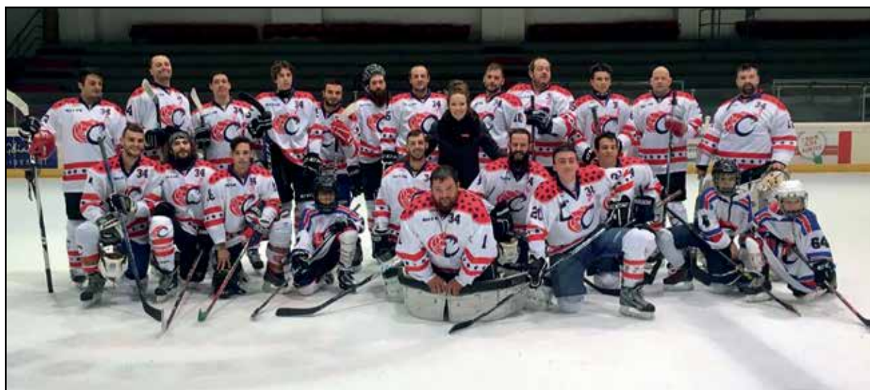
La squadra di hockey su ghiaccio al Palaghiaccio di Montichiari.

Fra le molteplici attività sportive che Montichiari può vantare sul suo territorio si è aggiunta ora anche la SQUADRA DI HOCKEY su ghiaccio che si allena presso il Palaghiaccio, una struttura sempre più frequentata dagli amanti del pattinaggio.