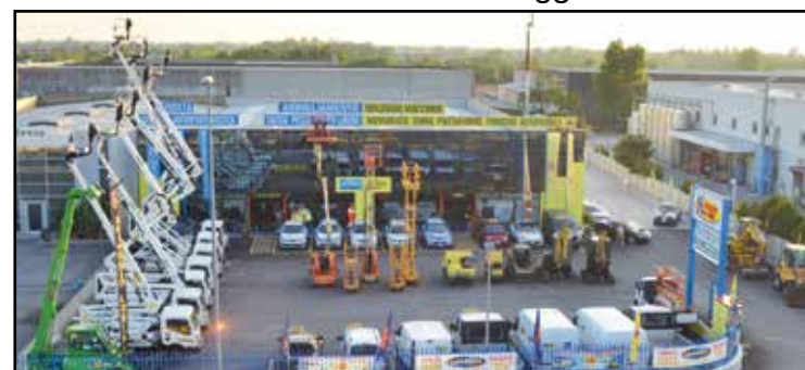
La nuova sede della Noleggio Lorini in zona industriale, via E. Montale 15.

SEDE: MONTICHIARI (BS) - Via E. Montale, 15 FILIALI: CALCINATO - CASTEGNATO tel. 030.9650556 - www.noleggiolorini.com