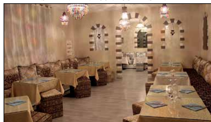
NUOVE SALE PER TUTTI

CUCINA ANCHE PER VEGETARIANI E VEGANI CON DOLCI SIRIANI TEL. 392 3650080