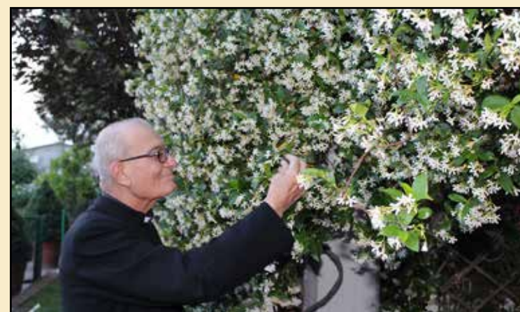
Ogni Briciola è un fiore dato con amore

TESTIMONIANZE DI VITA Lecture Briciole di Bontà sui temi LA VITA DI DON LUIGI LA FAMIGLIA STORICI RELIGIOSI AMORE E DONAZIONE