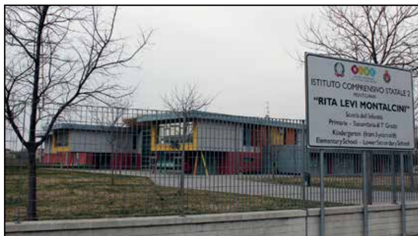
L'ampliamento previsto alla scuola di via Falcone.

Grazie ad una tecnologia specifica "in legno X-lam" e l'impiego di pannelli fotovoltaici, l'edificio offrirà una qualità abitativa ed un comfort decisamente superiori rispetto all'edilizia tradizionale con un mix ideale di umidità e temperatura oltre a garantire un deciso risparmio nelle spese di gestione per riscaldamento e raffrescamento (previste riduzioni nei consumi nell'ordine del 60/80%). Un altro punto qualificante sarà costituito dall'abbattimento delle barriere architettoniche al fine di rendere la scuola usufruibile appieno anche ai diversamente abili, nel solco della "filosofia" promossa dalla giunta comunale su tutto il territorio. Il